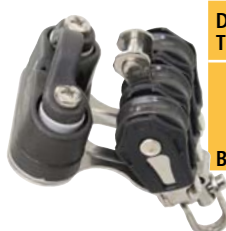
Dreifach, Wirbelauge, Kevlar Komposit Klemme Triple, swivel eye, Kevlar composite cleat