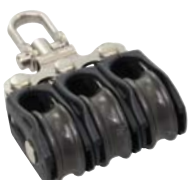
Wirbelauge Swivel Eye