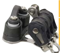
Dreifach, Festes Auge, Kevlar Komposit Klemme Triple, fixed eye, Kevlar composite cleat