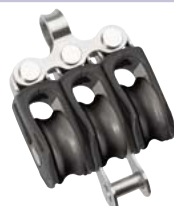
Festes Auge mit Unterbügel Fixed Eye with becket