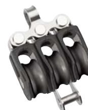
Wirbelauge mit Unterbügel Swivel Eye with becket