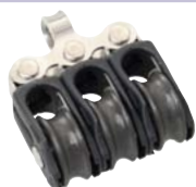
Festes Auge Fixed Eye